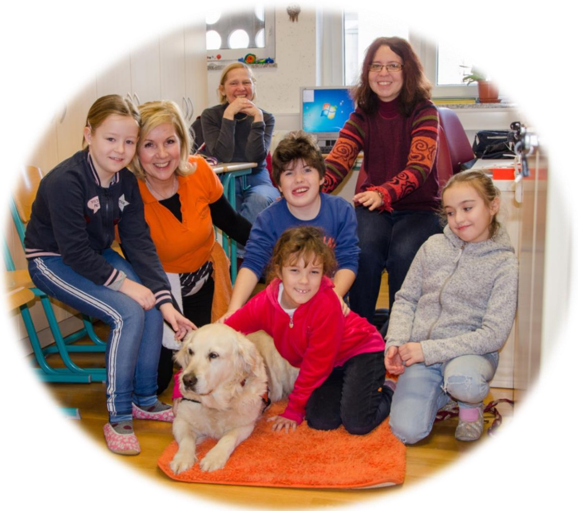
Pripravil in zapisal : Borut Šerbela